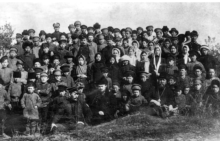
Преподаватели и ученики высшего начального и городского приходского училищ г. Вилюйска, 1913 год