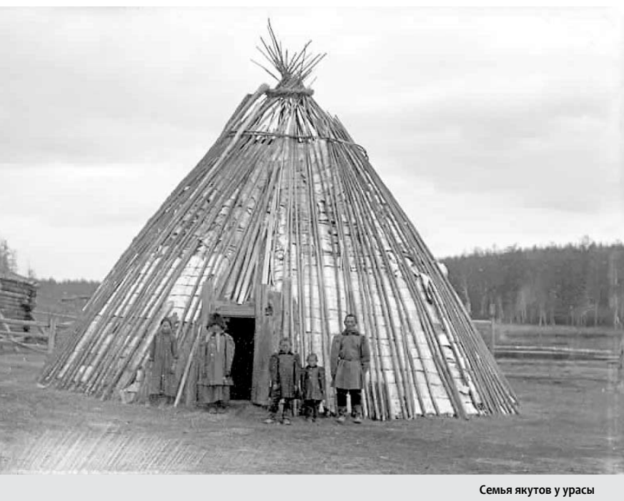
Семья якутов у урасы