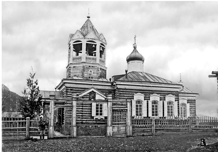
Никольская церковь в селе Больше-Пелудуйское, 1913 г.

Не без основания мы начали свою главу о просвещении инородцев светом Христовой веры, описанием устройства храмов и монастырей. В XVII столетии не могло быть и речи о широкой систематической организации дела просвещения христи-