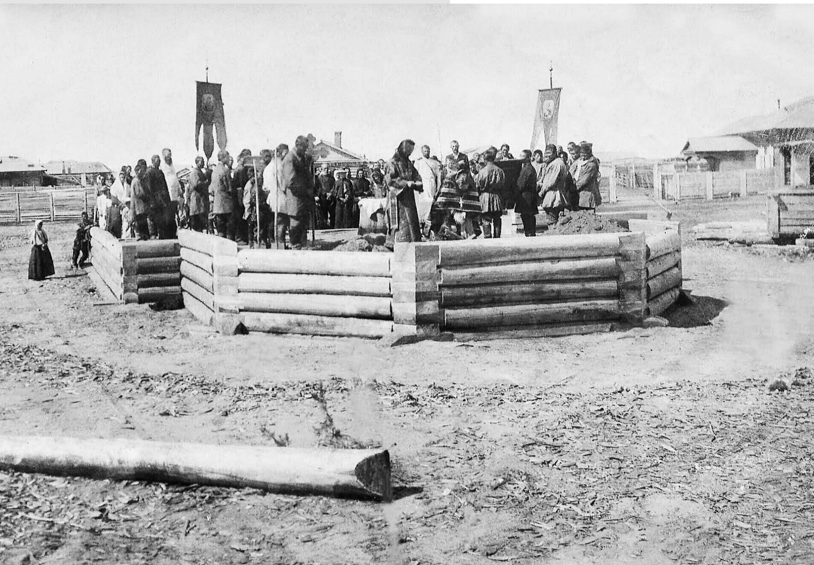
Освящение оклада церкви, г. Вилюйск, 1909 г.

Относительно заселения северных сибирских городов в XVII столетии, можно сказать, что они заселялись туго и из русских людей направлялись в оные лишь промышленники и зверовщики и преимущественно из северных местностей России, 15 особенно поморских городов: Устюга Великого, Сольвычегодска, Каргополя, Холмогор, Вятки, Новгорода и т.п. 16 Об Якутском крае необходимо заметить, что он в огромном большинстве, именно населен северянами, особенно вологодцами: замечено, что господствующее здесь наречие — вологодское и многие жители имеют однофамильцев и даже родственников в Вологодском крае. Как там, так и в Якутском крае много Поповых, во всех сословиях, также Винокуровых и Новгородовых.