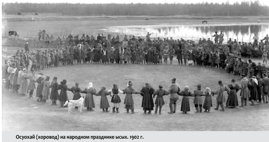
Осухай (хоровод) на народном празднике ысых. 1902 г.

Таким образом в Якутском остроге первым был соборный храм во имя Святой Живоначальной Троицы, с штатом священно-церковно-служителей. В 1708 г. по благословению Тобольского митрополита Филофея, при личном благословении и участии викария его, Иркутского епископа Варлаама, был заложен новый Троицкий Собор, уже каменный, в новой, юго-западной части “города” и в скором времени он