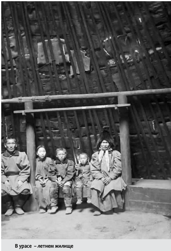
В урасе – летнем жилище

удовлетворению своих нужд, как “русского православного человека”. И потому знаем, что в более или менее значительных отрядах казацких всегда имелся свой “поп”. В то время, когда завоевывалась Якутская область, в церковном отношении дело обстояло лучше, чем при завоевании земель Западной Сибири, потому что в 1621 г. была открыта в Сибири архиепископская кафедра в г. Тобольске, заведывающая духовными и церковными делами всей Сибири. Историк Сибири — Словцев замечает, что «общее правило тогдашних русских: где зимовье ясачное — там и крест; или впоследствии часовня, где водворение крепостное, там церковь и пушка; ибо среди значительных отрядов, по благословию Тобольских Преосвященных, обыкновенно путешествовал священнослужитель со святыней. А где город, там правление — воеводское, снаряд огнестрельный, и монастырь, кроме церкви».